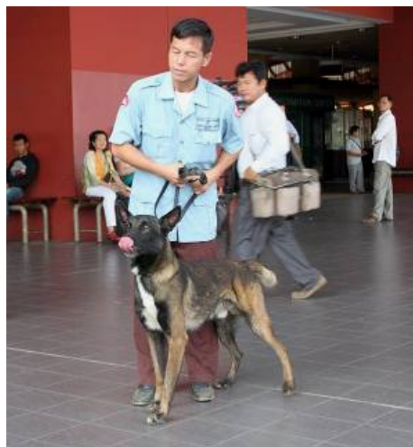
Minhund som anlände till Phnom Penh i mars 2014.