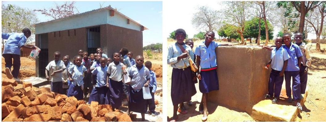
Två toaletter och anordning med rent, rinnande vatten för att tvätta händerna.

I dagarna skrev ZASP ett nytt avtal med Veterinärer utan gränser om ytterligare skoltoaletter 2018. Dessutom stödjer de arbetet för bra djurhållning i området genom kurser för veterinärassistenter som i sin tur sprider kunskapen i byarna.